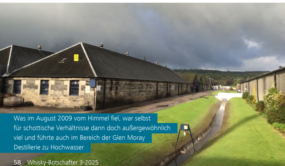
Was im August 2009 vom Himmel fiel, war selbst für schottische Verhältnisse dann doch außergewöhnlich viel und führte auch im Bereich der Glen Moray Destillerie zu Hochwasser

Der Regen endete schließlich und so schnell wie das Wasser gekommen war, so schnell war es auch wieder abgeflossen. Zur Abwechslung stellte sich nun eine stabile Hochdruck-Wetterlage ein. Was aber blieb, waren die Fässer – ein wahres Meer von Fässern – und die mussten jetzt alle wieder weg. Zwei Tage lang haben alle Mitarbeiter von Glen Moray bei nunmehr bestem Sonnenschein angepackt und Fässer gerollt, in Shorts, Shirts und mit Sonnenbrillen. So lange die Fässer im Wasser schwammen, waren sie relativ leicht zu bewegen. War das Wasser erstmal abgeflossen und sie lagen wieder auf dem Trockenen, mussten die schweren Fässer von Hand auf eine freie Fläche hinter der Brennerei gerollt werden, denn schließlich musste