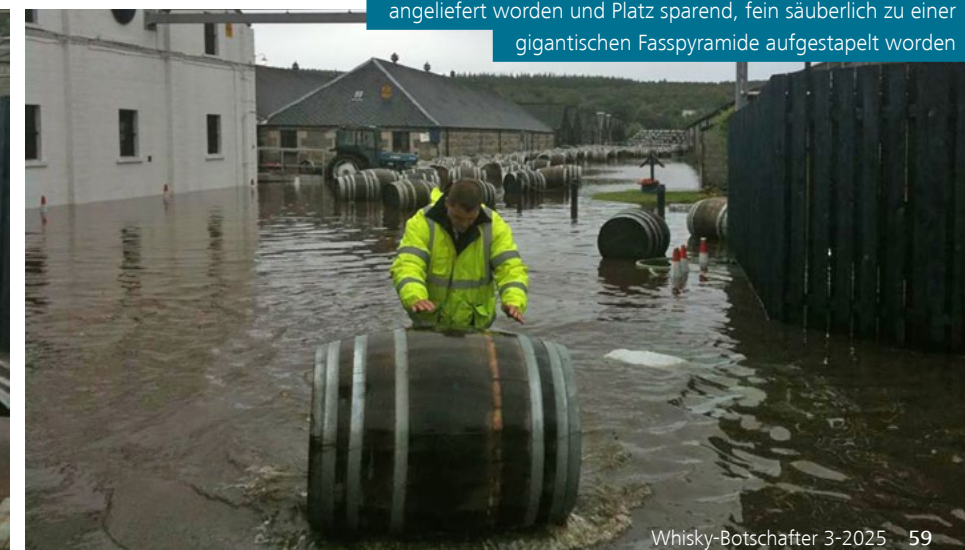
Zu dieser Zeit waren in der Destillerie 3.000 leere Fässer angeliefert worden und Platz sparend, fein säuberlich zu einer gigantischen Fasspyramide aufgestapelt worden