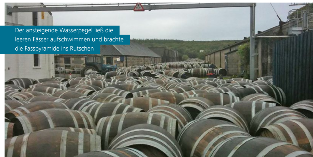
Der ansteigende Wasserpegel ließ die leeren Fässer aufschwimmen und brachte die Fasspyramide ins Rutschen