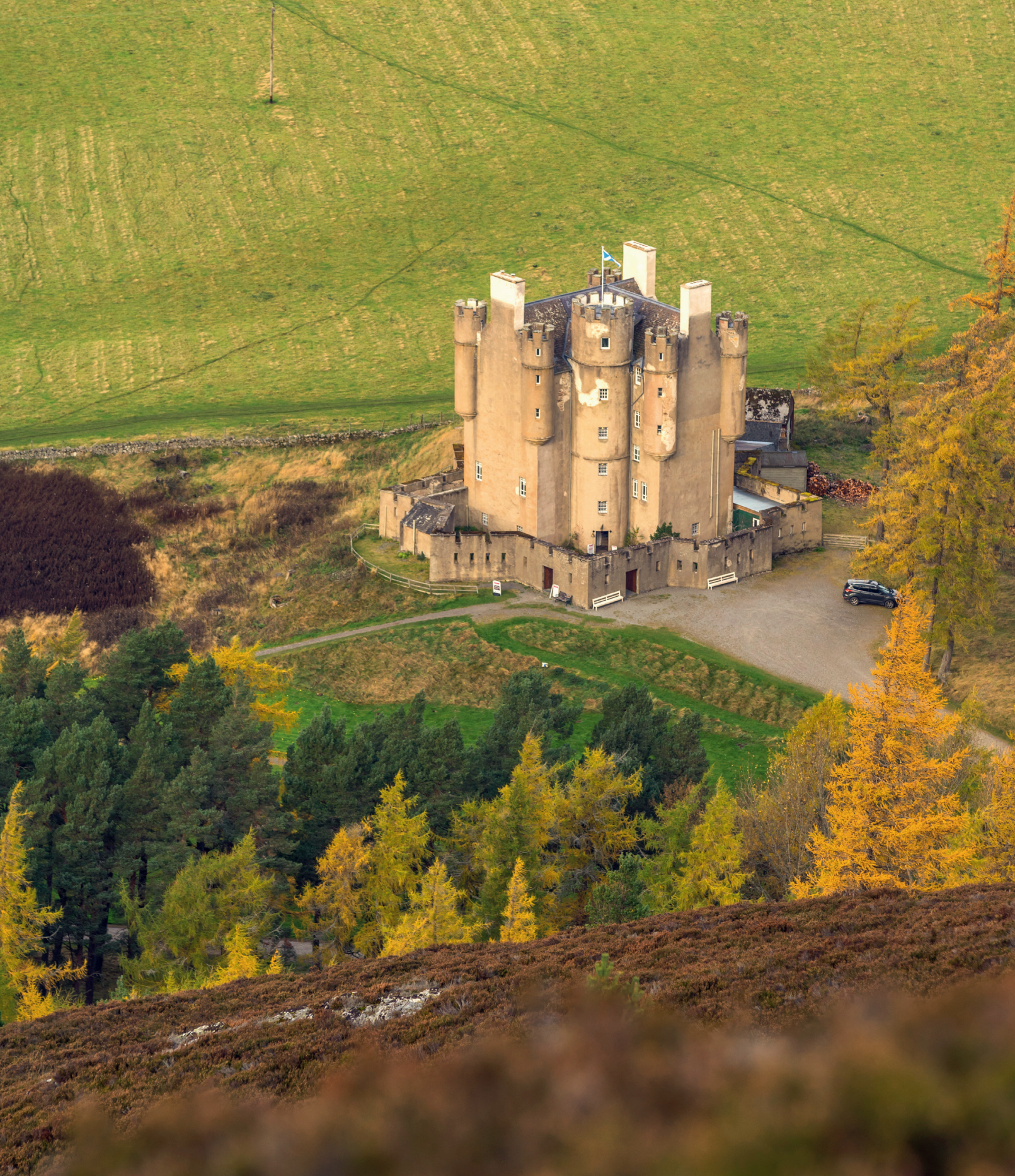
▲ Das Schloss Braemar Castle in Aberdeenshire wurde nach langer Pause im Jahr 2024 erstmals wiedereröffnet.